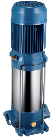
ULTRA 3-5-7 L