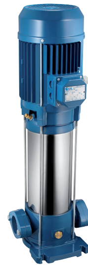
ULTRA 9-18 L